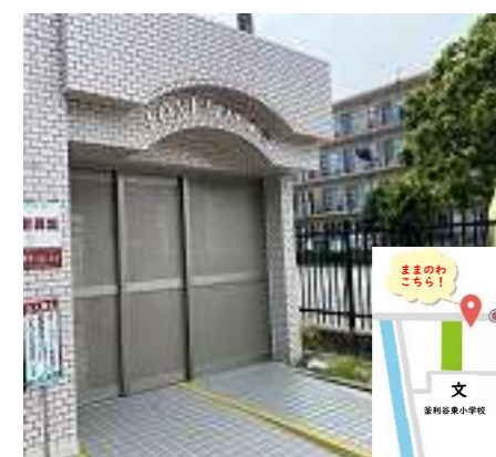
このマンションの門に入って突き当たり101号室です!