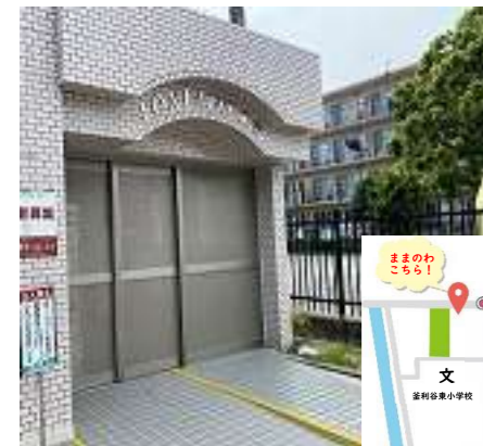
このマンションの 門を入れて突き当たり 101号室です!